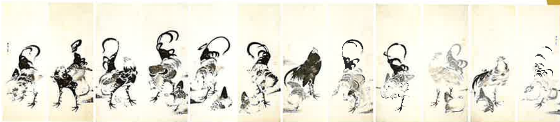
伊藤若冲《鶏図押絵貼屏風》寛政9年(1797)頃