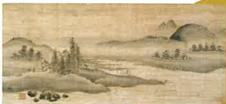
重要美術品 単庵智伝《桂寺晚鐘図》室町時代