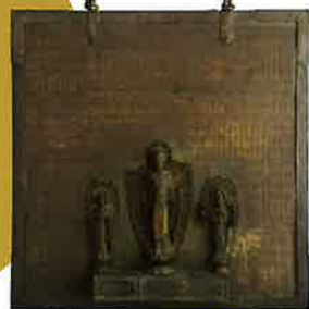
重要文化財 《金銅千体阿弥陀懸仏》 鎌倉前期

の中から厳選された重要文化財8件を含む各時代や分野を象徴する名品104件を展覧いたします。平安・鎌倉時代の仏教・神道美術、室町時代の水墨画や茶の湯釜、桃山から江戸にかけての茶陶や華麗な蒔絵、七宝と風俗画、さらに江戸時代絵画の中でも同館屈指のコレクションである日本美の象徴・琳派、天才絵師・伊藤若冲など、誰もが「心ときめく」美の空間へと誘う細見美術館ならではの至極の世界をご堪能ください。