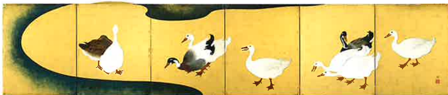
鈴木其一《水辺家鴨図屏風》江戸後期