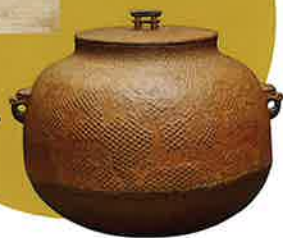
重要文化財 《芦屋葎地楓庵図真形釜》 室町時代