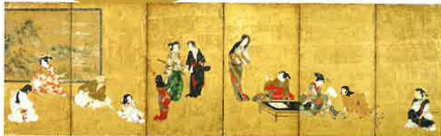
《男女遊楽図屏風》江戸前期