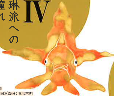
神坂雷佳 《金魚玉図》(部分)明治末期