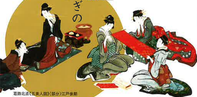
葛飾北斎《五美人図》(部分)江戸後期